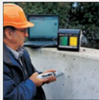
Prüfung und Datenübertragung an PC/Laptop.

Die Messdaten können über die serielle Schnittstelle RS 232 an einen handelsüblichen Drucker oder an einen PC/Laptop übermittelt werden.