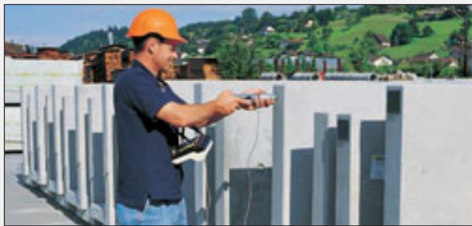
Serienprüfung an vorgefertigten Betonelementen mit automatischer Datenspeicherung.